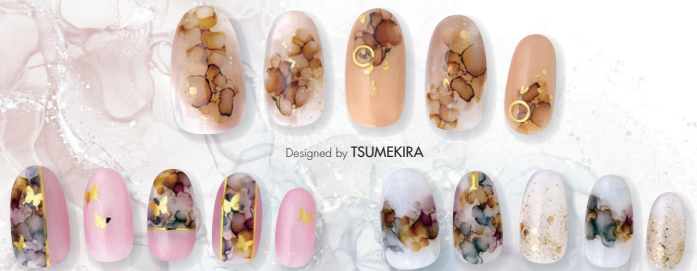
Designed by TSUMEKIRA