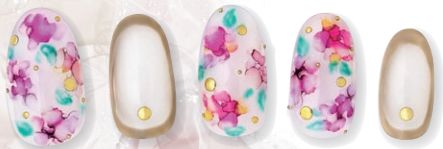
Designed by Hondo Kozue @conail.kozue