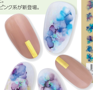
Designed by Hondo Kozue @conail.kozue