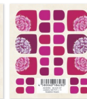
AK-KJR-107 Gradation flowers