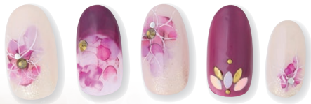
Designed by おっきー @nstyle.ohki