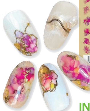
Designed by Karly from Hong Kong @betterme_k