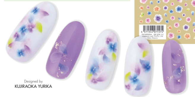
Designed by KUJIRAOKA YURIKA

透け感のある花が繊細で涼しげで、重なり合うグラデーションがとても美しいシールです。