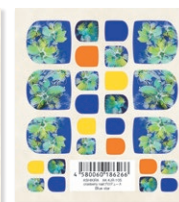
AK-KJR-105 Blue star