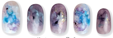
Designed by Ying from Singapore @nailartexpress