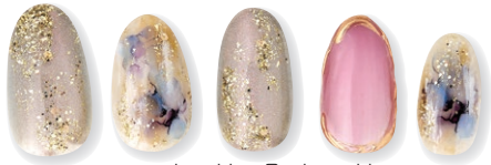
Designed by Takagi Chiharu @nailroom_chiharu

ニュアンスアートに欠かせないインクアートをシールにしました。 貼るだけでインクアートのリアル感を再現!!新色のブルー系とピンク系が新登場。