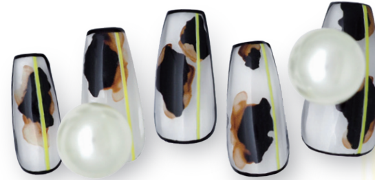
Designed by MEGU