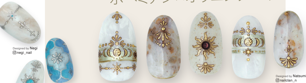
Designed by Negi @negi_nail

シリーズで使えるセレスティアルデザイン 異国感漂う ボヘミアン×オリエンタルネイル。