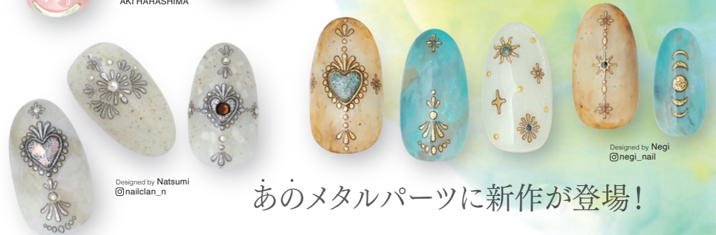
Designed by Natsumi @nailclan_n