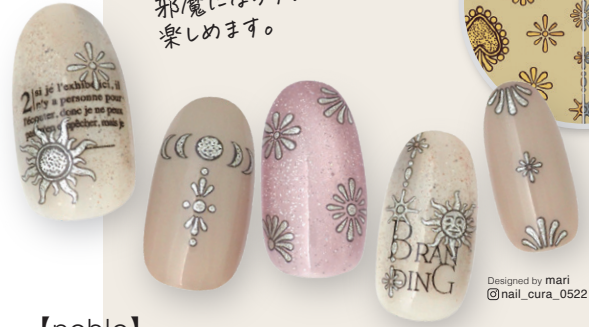
Designed by mari @nail_cura_0522