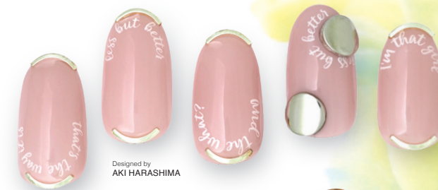
Designed by AKI HARASHIMA

AKI HARASHIMAプロデュース Arc textの第3弾! 筆記体バージョン